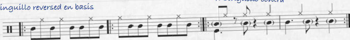
4. Cinguillo contra