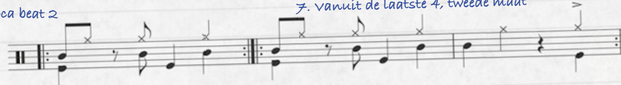
7. vanuit de laatste 4, tweede maat