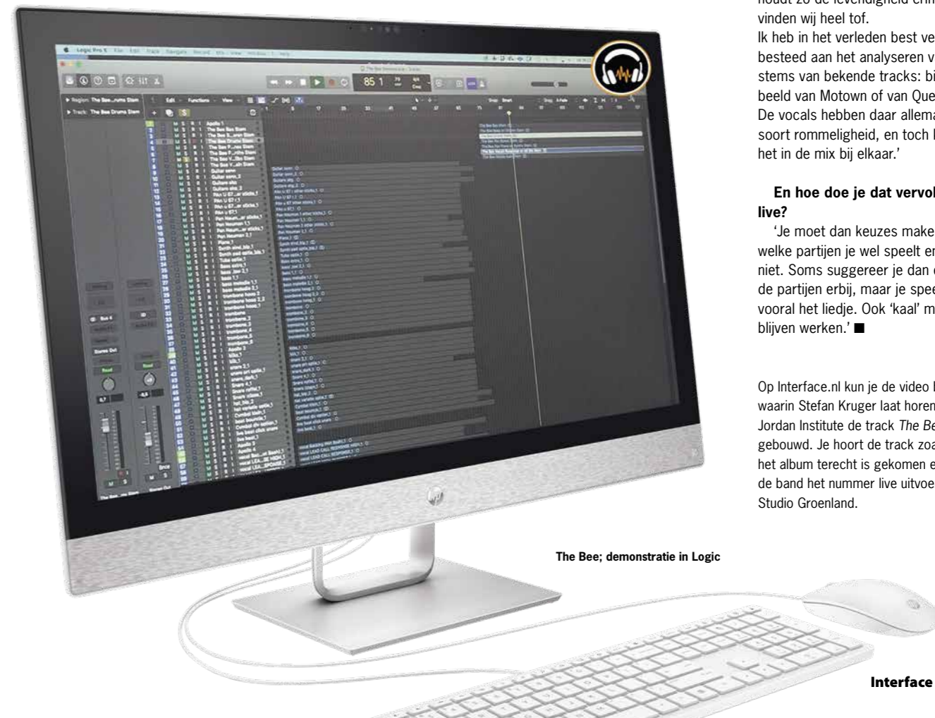
The Bee; demonstratie in Logic