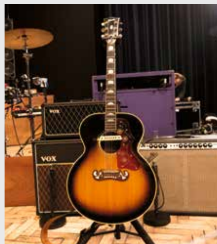
Gibson J-200: gebruikt voor Here Comes The Sun . In deze zit een LR Baggs pickup zonder piëzo