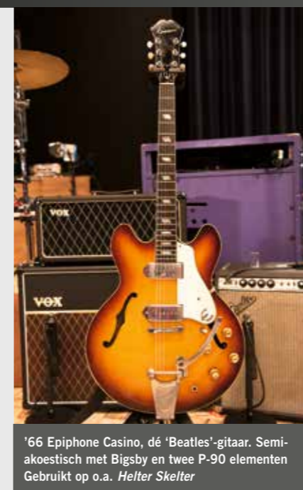
'66 Epiphone Casino, dé 'Beatles'-gitaar. Semi-akoestisch met Bigsby en twee P-90 elementen. Gebruikt op o.a. Helter Skelter