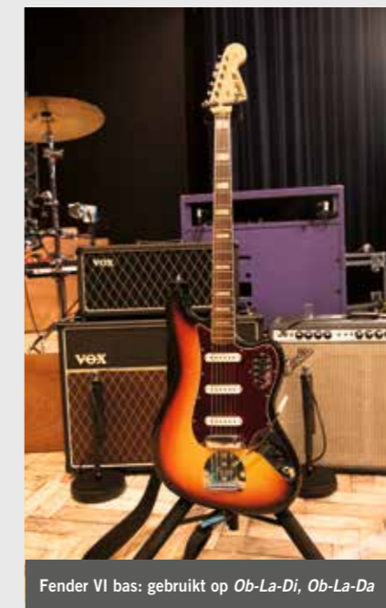
Fender VI bas: gebruikt op Ob-La-Di, Ob-La-Da