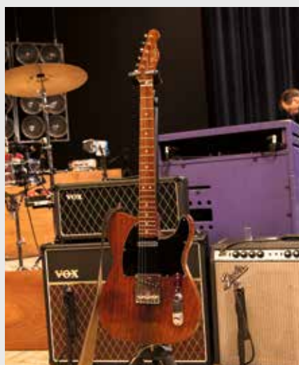
Rosewood Telecaster '71. Hiervan zijn er maar 300 gemaakt, gebruikt voor o.a. Maxwell's Silver Hammer en Octopus's Garden

» hebben gewonnen. We kwamen allemaal uit het zuiden, maar zijn op een gegeven moment wel allemaal naar Amsterdam verhuisd. Vooral voor het werk.”