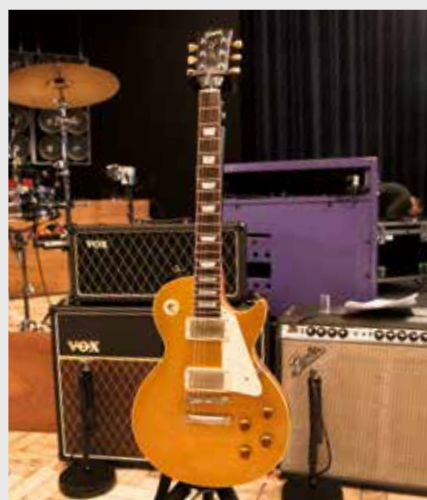
Les Paul Gold Top: gebruikt voor o.a. Something . Hierbij werd ADT gebruikt: Automatic Double Tracking