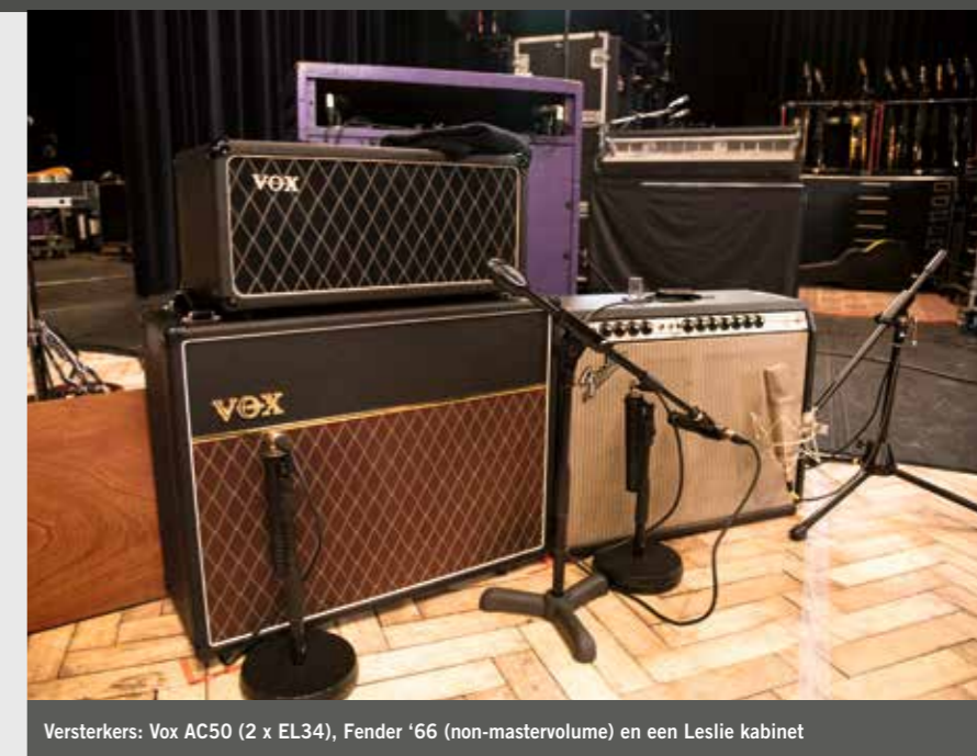
Versterkers: Vox AC50 (2 x EL34), Fender '66 (non-mastervolume) en een Leslie kabinet

akkoord is dat normaal, maar bij een E en een G doet hij dat ook. Daarmee draai je dus de bas om.”